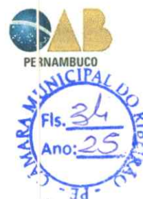
TABELA DE HONORÁRIOS ADVOCATÍCIOS OAB/PE – (Atualizada 2025)